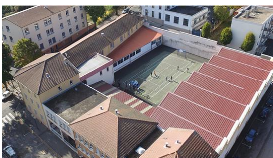
Lycée Notre Dame de Bel Air 5 avenue des Belges, 69170 Tarare