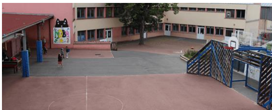
Ecole Notre Dame de Bel Air 2 rue Nicolas Sève 69170 Tarare

« La joie de l'Évangile remplit le cœur et toute la vie de ceux qui rencontrent Jésus. » Pape François.